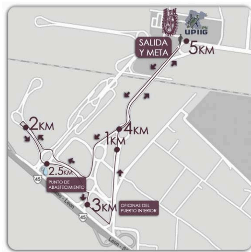
Mapa señalando ruta de 5 KM Puerto interior.

El circuito es dentro de las instalaciones del Fraccionamiento Industrial Puerto Interior, por la Av. Mineral de Valenciana hasta llegar a la meta que se encuentra en la explanada del Edificio de Gobierno de UPIIG.